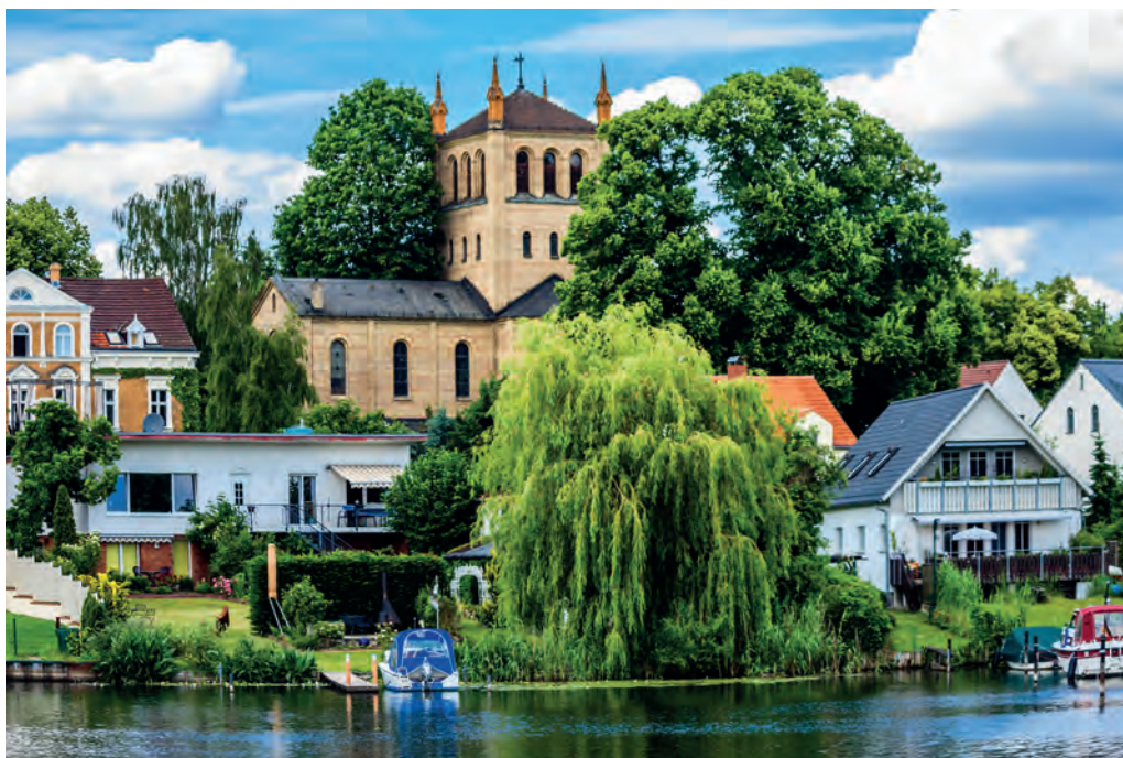
Repräsentative Anwesen säumen die Ufer des Wannsees und der Havel

Den Test mit Fahrwerten der Inter Cruiser 29 finden Sie auf www.motorbootonline.de in der Rubrik „Testberichte“.